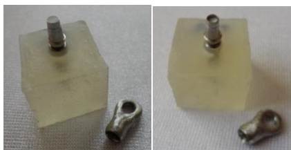
شکل ۱: الف) پرکردن ناقص حفره دسترسی اباتمنت ب) پرکردن کامل حفره دسترسی اباتمنت