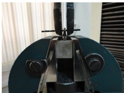
شکل ۲: انجام تست کشش توسط دستگاه یونیورسال