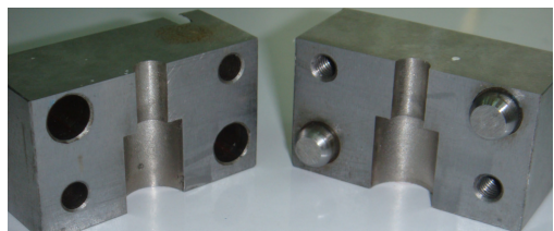
تصویر ۳: ایندکس تعیین کننده ضخامت ونیر

دای ها در مقطع افقی، گرد بوده و سطح اکلوژال برای ساده تر شدن مراحل کار مسطح تراشیده شد. سعی بر این بود که دای ها به فرم و سایز یک پره مولر ماگزایلا به دست آید.