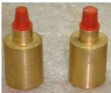
تصویر ۱: دای های برنجی

توسط پرسلن ونیر مخصوص e.max که از جنس فلوراپاتیت است و با کمک ایندکس سومی که توسط دستگاه تراش ساخته شده بود، کرون های نهایی به فرم استوانه ای به قطر 6/4\text{mm} و ارتفاع 7\text{mm} فرم داده شد (تصویر ۳ و ۴).