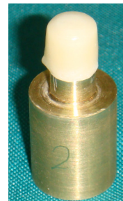
تصویر ۴: کرون نهایی

میانگین نیروی شکست در گروه‌های مختلف در جداول ۱ آورده شده است. آنالیز واریانس یک طرفه تفاوت معنی داری بین گروه‌ها نشان داد ( P < 0/001 ). با استفاده از آزمون مقایسه چندگانه Tukey گروه‌ها مقایسه شدند (جدول ۲). میانگین نیروی شکست در ضخامت کوپینگ ۰/۶ به علاوه ضخامت ناشی از تفاوت زاویه تراش از ۶ درجه به ۱۲ درجه بیشتر از ۰/۶mm بود ولی تفاوت آماری قابل توجهی بین این دو ضخامت وجود نداشت ( P > 0/05 ). ولی استحکام شکست در دو درجه تقارب تفاوت قابل توجهی داشت و میانگین نیروی شکست در تقارب ۱۲ درجه به طور قابل توجه بیشتر از ۶ درجه بود ( P < 0/05 ).