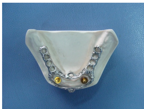
تصویر ۱ : فریم ورک کروم کبالت بر روی کست ساخته شده است.