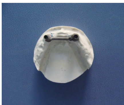
تصویر ۴ : بار فلزی قرار گرفته روی کست تریم شده