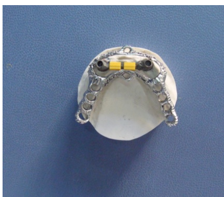
تصویر ۵ : قرار دادن ۲ کلیپ بر روی بار پیش ساخته و قرار دادن فریم فلزی بر روی مجموعه