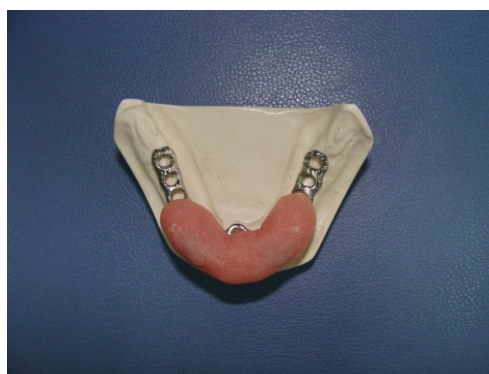
تصویر ۲ : بیس آکریل خودپخت بر روی فریم فلزی