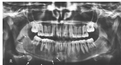
تصویر ۱: ضایعه Expansile با گسترش از مزایال دندان ۳ تا ناحیه رترومولر سمت راست فک پایین دیده می‌شود.

در تشخیص افتراقی با توجه به نماهای رادیوگرافیک، اوسیفاینگ فیروما (Ossifying fibroma)، سیست ادنتوژنیک کلسیفیه شونده (COC)، ژانت سل گرانولومای مرکزی (CGCG)، و آملوبلاستیک فیروادنتوما (AFO) مطرح گردید.