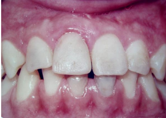
تصویر ۳: نمای کلینیکی دندان پس از درمان و ترمیم تاج

طی درمان، بیمار جهت انجام جراحی کوچک پریودنتال ناحیه معرفی و پس از گذشت ۶ هفته از جراحی، ترمیم دائمی دندان بوسیله مواد ترمیمی یا پست کران انجام شد (تصویر ۳).