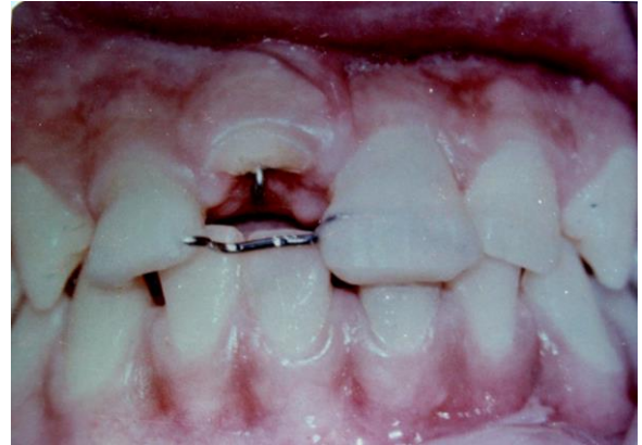
تصویر ۱: نمای کلینیکی قرار دادن پست در کانال دندان و باند کردن میله افقی روی دندانهای پایه توسط کامپوزیت

از ۱۲ بیمار مورد مطالعه ۴ نفر مونث و ۸ نفر مذکر بودند. میزان extrusion با توجه به نقص موجود، در ۵ دندان ۳