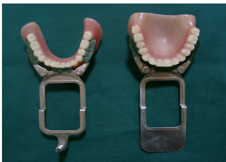
تصویر ۱: نحوه اتصال ابزار ترسیم خارج دهانی به دنجر بیمار

جهت آزمون نرمال بودن متغیرهای کمی فواصل افقی، قدامی - خلفی و مستقیم نقاط ثبت شده نسبت به نقطه ثبت شده در روش داوسون در پوزیشن‌های سه گانه ابتدا آزمون Kolmogrov-smirnov انجام شد و میزان P برای هر کدام اندازه‌گیری محاسبه گردید. از آنجائی که هیچکدام از متغیرهای مذکور اختلاف معنی‌داری با توزیع نرمال نداشتند ( P > 0.05 )، جهت سنجش آنها از آزمون‌های t -student و آنالیز واریانس یکطرفه (ANOVA)، توکی و همبستگی پیرسن استفاده شد.