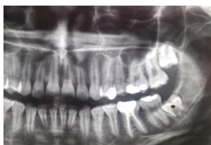
تصویر ۱: بررسی دندان عقل نهفته از روی رادیوگرافی

مرحله دوم، برداشت استخوان پوشاننده بود که معمولاً در فک بالا به برداشت استخوان نیازی نیست. اما در صورت لزوم، استخوان در سمت باکال دندان برداشته شد. مرحله سوم، قطع کردن دندان بود که در فک بالا به ندرت دندان قطع می‌شود زیرا استخوان پوشاننده معمولاً نازک و نسبتاً الاستیک است. مرحله چهارم، خارج کردن دندان بود.