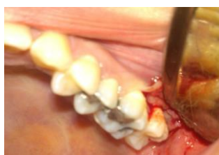
تصویر ۲: کنار زدن فلپ (نوع فلپ Envelope)