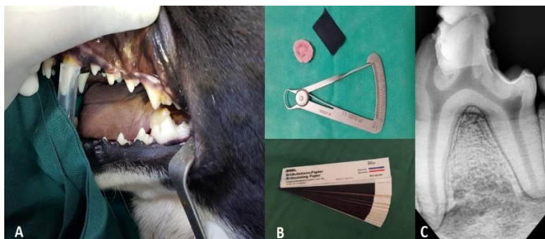
تصویر ۱: نمای کلینیکی و رادیوگرافیک ایجاد ترومای اکلوزن بر دندان مولر پایین سگ توسط اندکس اکریلی و کامپوزیت که افزایش ارتفاع اکلوزال توسط نوار آرتیکولاسیون و گیج مدرج تایید شده است.

مروری بر مطالعات نشان می‌دهد که تحقیقات انجام شده بر روی تاثیر ترومای اکلوزن بر راکسیون پالپ، پری اپیکال و PDL دندان‌های سگ، بسیار محدود می‌باشد. (۸-۱۱) Zhou و همکاران (۵) و Lindhe و Ericsson (۹) در مطالعات خود نتیجه گرفتند که ترومای اکلوزالی به تنهایی نمی‌تواند در پریدنتال لیگامنت ایجاد تخریب کند و حتماً باید التهاب و پریدنتیت همراه آن وجود داشته باشد، اما در این زمینه، طبق مطالعه Rodriguez و