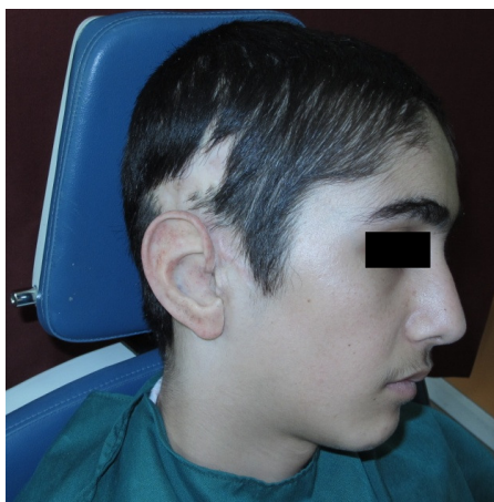
تصویر ۶ : نمای طرفی از پروتز گوش