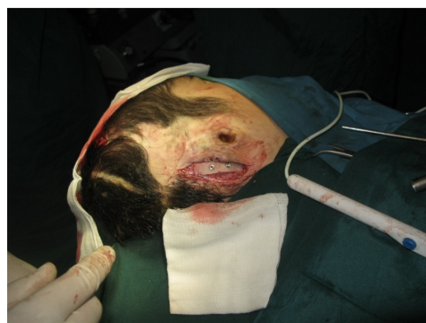
تصویر ۲ : ایمپلنت‌های قرار داده شده در گرفت در پشت سوراخ گوش