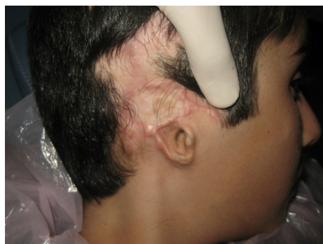
تصویر ۱ : نمای گوش سمت راست از دست رفته بیمار