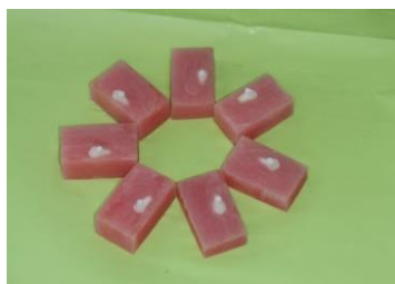
شکل ۲. نمونه‌های مانت و ترمیم شده

سپس نمونه‌ها در رطوبت ۱۰۰ درصد و دمای اتاق به مدت یک ماه و پس از آن به مدت دو هفته در آب مقطر با دمای 37 \pm 1 درجه‌ی سانتیگراد نگه‌داشته شدند. پس از آن نمونه‌ها ۱۵۰۰ بار تحت عملیات سیکل حرارتی با دستگاه ترموسیکل (شرکت وفایی، تهران، ایران) قرار گرفتند.