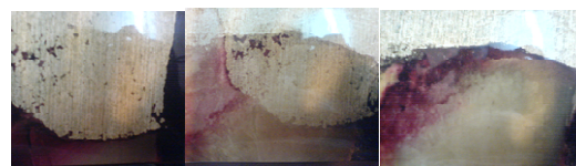
تصویر ۱: نمونه های آمالگام در زیر استرنومیکروسکوپ

جدول ۲ شدت نفوذ رنگ در دیواره های حفرات ترمیم شده را نشان می دهد. به طوری که مشاهده می شود شدت نفوذ رنگ در کد ۰ در دندان های ترمیم شده با آمالگام در مقایسه با همین کد در دندان های ترمیم شده با Core max II با هم برابر بود. این مقایسه در کد ۱ نشان دهنده تفاوت اندکی بین این دو ماده ترمیمی بود. در کد ۲ نیز تفاوت زیادی مشاهده نشد. همچنین این دو ماده ترمیمی در زمینه شدت نفوذ رنگ در کد ۳ با هم برابر بودند. در نتایج آماری به دست آمده از مقایسه ریزش آمالگام و Core max II تفاوت معنی داری مشاهده نشد ( P>۰/۰۵ ).