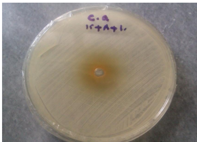
تصویر ۱: تشکیل هاله‌ی عدم مهار رشد در آزمایش چاهک‌گذاری دهانشویه شماره ۵.