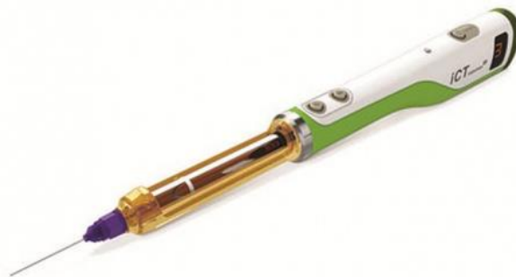
شکل ۱: دستگاه بی حسی کامپیوتری (GENOSS, Gyeonggi-do, South Korea) ICT Injection

ترومای مکانیکی ناشی از ورود سوزن، تزریق عامل بی-حسی در بافت و بیرون آوردن سوزن اغلب دردناک هستند. (۱۲) روش‌هایی که برای کم کردن درد ورود سوزن استفاده می‌شوند (مثل تزریق آهسته، گرم کردن مایع بی حسی، استفاده از سوزن نازک‌تر، استفاده از ویراجکت و استفاده از ژل‌های بی حسی موضعی قبل از تزریق از جمله ژل‌های گیاهی) برای همه بیماران، به ویژه برای کودکان مضطرب و غیرهمکار که ترسیده‌اند؛ کافی نیست. (۱۳، ۱۴) معمول‌ترین روش بدست آوردن بی حسی در دندان‌های ماگزایلا، اینفیلتراسیون باکال (تزریق سوپراپریوستال) یا اصطلاحاً تزریق کانونشنال است. (۱۵-۱۸) امروزه به علت وجود تجربه دردناک و ناخوشایند ناشی از تزریق بی حسی که به دنبال استفاده از سرنگ‌های قدیمی در بیماران ایجاد می‌شود؛ بسیاری از تکنیک‌های تزریق بی حسی به روش اتوماتیک و کامپیوتری در حال توسعه و پیشرفت هستند. (۱۹) (شکل ۱) یکی از جنبه‌های این پیشرفت، راه‌اندازی یک