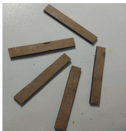
شکل ۳: مولد های چوبی تهیه شده توسط دستگاه لیزر