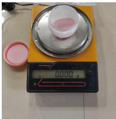
شکل ۲: افزودن نانوذرات به پودر رزین آکریلی با استفاده از ترازوی دیجیتالی با دقت ۰/۰۰۱ گرم به طور جداگانه برای هر یک از نمونه ها

در مرحله بعد رزین آکریلی موجود در مفل با استفاده از حمام آب ۹۵ درجه به مدت ۲ ساعت، کیور شد و سپس بعد از رسیدن به دمای محیط مفل ها از حمام آب خارج شدند، سپس مراحل دفلاکس انجام شد. جهت فینیش نمونه ها، ابتدا لبه های اضافی توسط فرز هندپیس آکریل بر برداشته شد و در مرحله بعدی جهت رسیدن به ابعاد