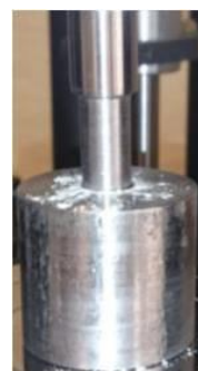
تصویر ۱: دستگاه سمبه ماتریس

این دستگاه از دو بخش فلزی مجزا تشکیل شده است. قسمت استوانه ای پهن این وسیله ماتریس نام دارد که داخل آن به شکل استوانه ای با قطر ۱۰ میلی متر خالی می باشد. بخش دیگر سمبه نامیده شده و به منظور فشرده کردن ماده مورد نظر داخل ماتریس کاربرد دارد. قطر سمبه حدود ۱۰ میلی متر می باشد. برای آماده سازی دیسک های حلقه ای هر یک از مواد مورد مطالعه، مقدار مورد نظر برای تهیه ی استوانه ای با قطر ۱۰ میلی متر و ضخامت ۱ میلی متر تخمین زده شد و با ترازوی دیجیتال (SI-114, Denver Instrument, New York, USA) توزین گردید. سپس ماده ی مورد نظر طبق دستور کارخانه سازنده در حالی که نسبت دقیق پودر به مایع مورد استفاده و میزان آب به کار رفته به صورت دقیق رعایت شده بود مخلوط شد و با استفاده از اسپاتول داخل ماتریس قرار داده می شد. سطح داخلی سمبه و ماتریس برای جلوگیری از ایجاد هر نوع تداخل با مواد، از قبل با پنبه آغشته به الکل به طور کامل تمیز می شد. پس از آن سمبه به داخل ماتریس وارد می شد و زیر دستگاه پرس Santam/STM-20 (سانتام، تهران، ایران) با فشار تقریبی ۱۰۵ میکرو پاسکال، تا زمان ستینگ نسبی ماده به مدت ۵ دقیقه قرار داده می شد.