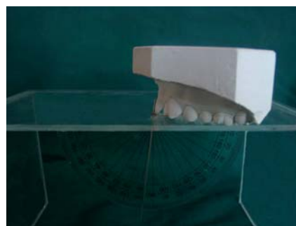
تصویر ۱: روش اندازه گیری تورک دندان توسط دستگاه TIP

در مرحله آخر جهت بررسی میزان دقت در تکرار اندازه گیری تیپ و تورک و شاخص PAR، ۱۶ مدل مطالعه بعد درمان (۸ مدل مطالعه از بیماران گروه اج و ایز و ۸ مدل مطالعه از بیماران گروه استریت و ایر) به شکل کاملاً تصادفی انتخاب شدند و برای نوبت دوم مورد اندازه گیری قرار گرفتند. آزمونهای هم بستگی در بین دو نوبت اندازه گیری شد تا میزان دقت در تکرار اندازه گیری (Reproducibility) بین آزمونهای نوبت اول و دوم اندازه گیری بررسی شود. در گروه اج و ایز میزان هم بستگی بین دو نوبت اندازه گیری برای تیپ P=0/01 ، r=0/96 ، برای تورک P<0/02 ، r=0/93 و برای