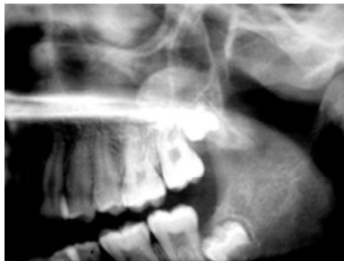
تصویر ۱: A و B تصاویر موکوس ریتنشن کیست در سینوس فک بالای سمت چپ دو بیمار