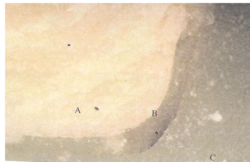
تصویر ۲: نمای میکروسکوپی گپ افقی یک کوپینگ در گروه