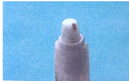
تصویر ۱: نمای دای رزینی با notch در باکال

الماسه به ضخامت ۰/۷ میلی‌متر برش خوردند و فاصله افقی در محل تلاقی دیواره اگزپال تراش با سطوح داخلی کوپینگ در دو نقطه در وسط سطوح باکال و لینگوال توسط میکروسکوپ نوری Olympus BH60 با دقت ۱ میکرون اندازه‌گیری شد (تصاویر ۲ و ۳).