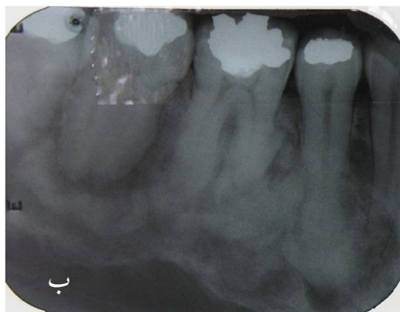
تصویر ۴: الف) در رادیوگرافی پانورامیک رادیوآپسیتیه‌های هموزن متعدد با حدود مشخص در نواحی پری آپیکال دندان‌های فک بالا و در فک پایین بالای کانال مندیبول به همراه ریم لوسنت مشاهده می‌شود. ب) در رادیوگرافی پری آپیکال رادیوآپسیتیه‌های هموزن متعدد با حدود مشخص در نواحی پری آپیکال دندان‌های پره مولر اول تا مولر دوم سمت راست فک تحتانی به همراه ریم لوسنت مشاهده می‌شود. دندان پره مولر دوم سمت راست فک تحتانی دچار هیپرسمتوز شده است.