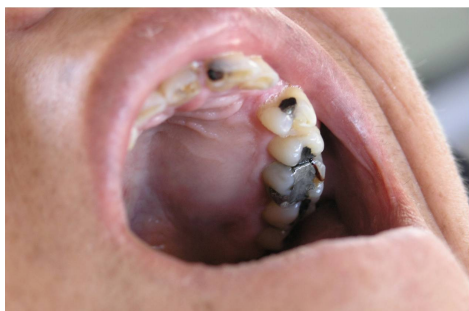
تصویر ۳: Expansion با قوام سخت استخوانی در محاذات ریشه دندان‌های پره مولر اول تا مولر دوم سمت چپ فک فوقانی