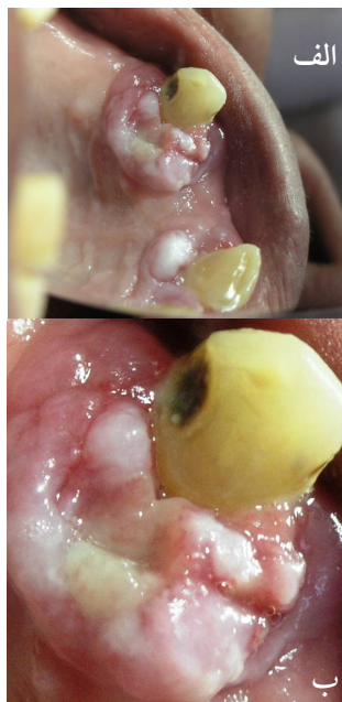
تصویر ۱: الف) ضایعه برجسته در مجاورت دندان‌های کانین سمت چپ و ثنائی مرکزی سمت راست که در ناحیه دندان کانین هم به باکال و هم به پالاتال گسترش یافته است. ب) ضایعه برجسته در مجاورت دندان ثنائی مرکزی فقط در پالاتال وجود دارد.