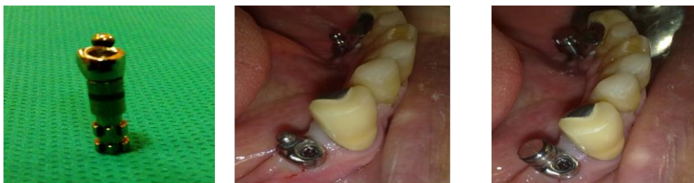
شکل ۲: بال اباتمنت اختصاصی ساخته و در دهان بسته شد