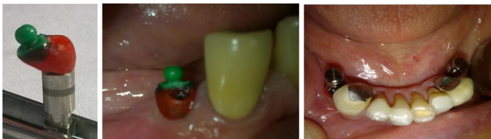
شکل ۱: امتحان وکس آپ بال اباتمنت اختصاصی در دهان

برای این کار ابتدا توسط یک هندپیس متصل به سوریور ( AF30 milling machine ) سطح باکال اباتمنت UCLA تمام پلاستیک موازی با بال اباتمنت پره مولر اول سمت چپ پایین تراشیده شد سپس اباتمنت توسط