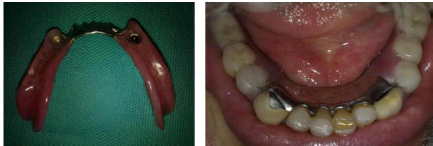
شکل ۳: نصب پروتز پارسیل در دهان

پروتز پارسیل در دهان قرار داده شد و فضای کافی برای اکریل خودپلیمریزه شونده جهت نصب اتچمنت ها ایجاد گردید. دو عدد سوراخ در ناحیه لینگوال پروتز پارسیل جهت فرار اکریل اضافی ایجاد و اتچمنت ها با استفاده از اکریل خودپلیمریزه شونده نصب شدند. پروتز