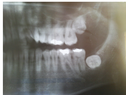
تصویر ۱: تصویر O.P.G بیمار قبل از درآوردن دندان

بیمار آقای ۳۳ ساله جهت جراحی و خارج کردن دندان عقل نهفته فک پائین به مطب دندانپزشک مراجعه کرده بود. دندان مذکور به صورت افقی و به طور باکولینگوالی قرار گرفته بود (تصویر ۱).