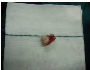
تصویر ۳: تصویر دندان پس از خارج شدن

بعد از انجام آزمایشات لازم، بیمار آماده عمل شد. تحت بیهوشی عمومی و انتوباسیون نازوتراکئال از محل انسیزیون قبلی و با برش سیرکولار در سمت لینگوال دندان‌های خلفی فلپ لینگوالی بلند شده وبا استفاده از هدایت انگشتان دو دست و هموستات، دندان از فضای تحت فکی خارج شد (تصویر ۳).