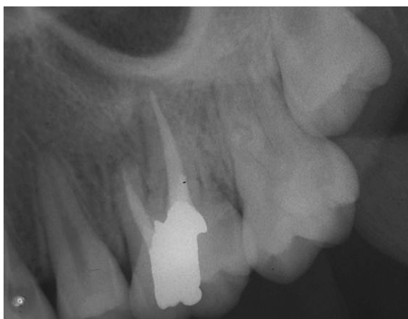
شکل ۴: رادیوگرافی تهیه شده ۱ سال بعد از جراحی