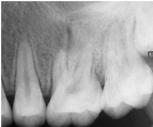
شکل ۱: رادیوگرافی اولیه

تماس‌های اکلوزالی مجدد چک شد و دندان مورد نظر به طور کامل از اکلوزن خارج شد. فالوآپ ۱۰ روز و یک سال (شکل ۴) بعد مجدد انجام شده و بهبودی کامل کلینیکی مشاهده شد.