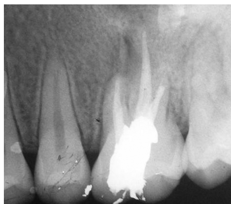
شکل ۲: رادیوگرافی تهیه شده بلافاصله بعد از RCT و پر کردن با آمالگام