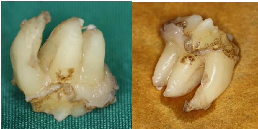
تصویر ۲: نمای دو دندان به هم چسبیده