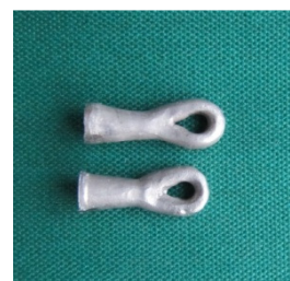
تصویر ۲: کوپینگ فلزی ساخته شده و حلقه متصل برای ایجاد کشش

نمودیم. با استفاده از رزین سلف کیور دورالی (Duralay, Reliance Dental Mfg Co, USA) روی فضا ساز، کوپینگ به گونه ای فرم داده شد که در تمام سطوح ضخامت کوپینگ ۰/۷ میلی متر باشد. روی مارژین هم با موم اینله (Kerr, Orange, California, USA) موم گذاری گردید. حلقه مومی به سطح اکلو زال کوپینگهای مومی به قطر ۶ میلی متر و ضخامت ۴ میلی متر متصل گردید تا برای ایجاد کشش بکار رود. الگوهای مومی اسپرو گذاری شدند و اینوستینگ با استفاده از اینوستمنت فسفات باند (Deguvest, Degudent, Densply, Tokyo, Japan) صورت گرفت. کوپینگهای فلزی با استفاده از آلیاژ غیر قیمتی نیکل-کروم (Vera Bond, 400 Watt Drive, Fairfield, CA, USA) تهیه گردیدند (تصویر ۲).