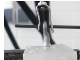
تصویر ۳: اتصال به دستگاه Universal testing جهت ایجاد

از سپری شدن ۱۰ دقیقه، اضافات سمان با استفاده از اکسکویتور قاشقی برداشته شد. نمونه‌ها قبل از تست به مدت ۴۸ ساعت در داخل بشر که توسط پارافیلیم سوراخدار (این مورد توسط مسوول لابراتوار بیوشیمی برای شبیه‌سازی بهتر با وضعیت دهانی توصیه شد.) پوشیده شده بود داخل بن ماری (Sheldon Manufacturing, JNC, 300N, 26TH, Cornelius, OR, USA) در دمای ۳۷ درجه سانتی‌گراد نگهداری می‌شدند. هر نمونه به دستگاه Universal Testing (Dartec-Co, UK, HC10) متصل گردید. نیروی کششی با سرعت ۰/۵ سانتی‌متر در دقیقه، تا زمان شکست باند به کوپینگ فلزی اعمال و نیوتن ثبت گردید (تصویر ۳). برای تعیین تأثیر نوع سمان بر میزان گیر کوپینگ‌ها از آنالیز واریانس دوطرفه استفاده شد.