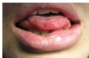
تصویر ۲: زخم‌های Maplike در نوک زبان بیمار