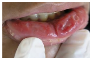
تصویر ۱: دو زخم Creater like و یک زخم Maplike در مخاط لب پایین بیمار در روز اول مراجعه

برنامه غذایی مردم ایران سرشار از گندم است، بنابراین تحمل ایمنی و اثر انتخاب ژنتیکی منفی می‌تواند موجب خفیف‌تر شدن بیماری در ایرانیان شده باشد (۱۸) در بیمار