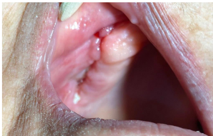
تصویر ۵: بسته شدن کامل محل جراحی و پایان یافتن علائم بیماری در فالوآپ ۳ ماهه