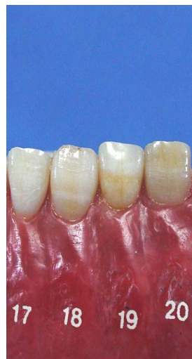
هفت روز بعد از شروع درمان میانگین درجه روشنی رنگ همین دندان ها معادل ۶ درجه گردید که نسبت به قبل از درمان ۲/۲ درجه کاهش پیدا یافته بود.