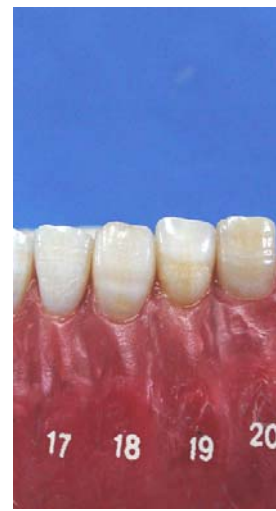
بعد از اتمام درمان میانگین درجه روشنی رنگ این دندان ها معادل ۳/۷ درجه گردید که نسبت به قبل از درمان ۴/۵ درجه کاهش یافته بود.