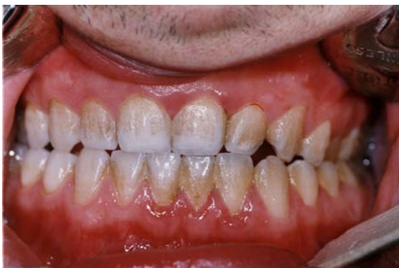
شکل ۴: تصویر نمونه ای از گروه کنترل (کلرهگزیدین) در انتهای مطالعه