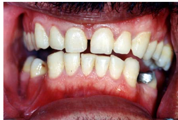
شکل ۳: تصویر نمونه ای از گروه آزمون (آب اکسیژنه و کلرهگزیدین) در انتهای مطالعه