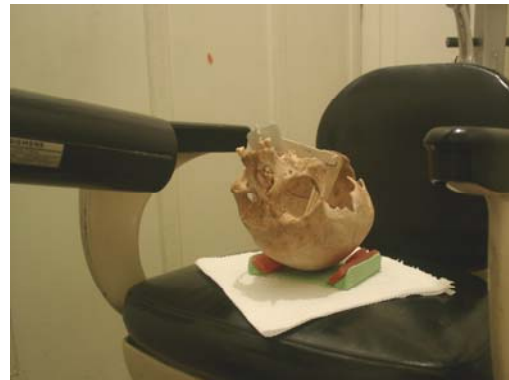
شکل ۱: نحوه عکسبرداری با دستگاه رادیوگرافی معمولی

آشکار ساز (Sensor) مورد استفاده ساخت پلن مگا فنلاند بود که اندازه ای حدوداً 23/1 \times 40/8 داشت. Resolution سیستم به میزان 26^{pl}/mm تعریف شده است و اندازه پیکسل های تصویر بوجود آمده حدوداً 30 \mu m می باشد که در فرمت ۱۲ بیتی توانایی نشان دادن ۴۰۹۶ سایه خاکستری متفاوت را دارد (محدوده پویای 2^{12} است).