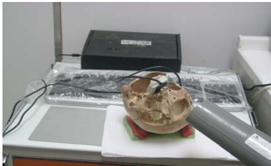
شکل ۲: نحوه عکسبرداری با دستگاه رادیوگرافی دیجیتال