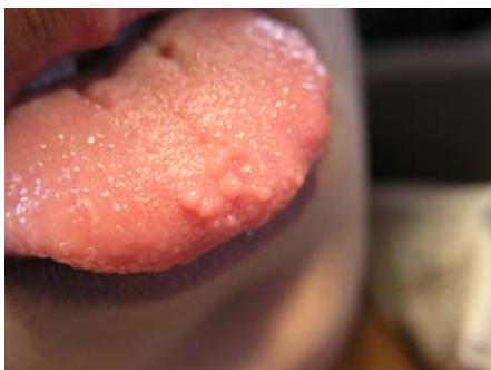
تصویر ۴: پاپولهای متعدد در نوک زبان و دو ندول برجسته در سمت چپ خط وسط مشخص می باشد

با توجه به علائم خارج و داخل دهانی، برای بیمار تشخیص بالینی سندروم MEN2B گذاشته شد. از پاپولهای ناحیه قدام زبان بیمار نمونه برداری انجام شد و برای بررسی میکروسکوپی به آزمایشگاه پاتولوژی ارسال گردید. در بررسی نمونه بیمار، با مشاهده تکثیر سلولهای عصبی بصورت ندولها و دستجات متعدد در زمینه ای از بافت همبند شل، تشخیص نورومای مخاطی گزارش گردید (تصویر ۵).