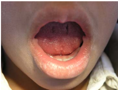
تصویر ۳: پاپولهای برجسته در کمیشورهای لب که مشخصه بسیار مهمی برای سندروم MEN2B می باشد