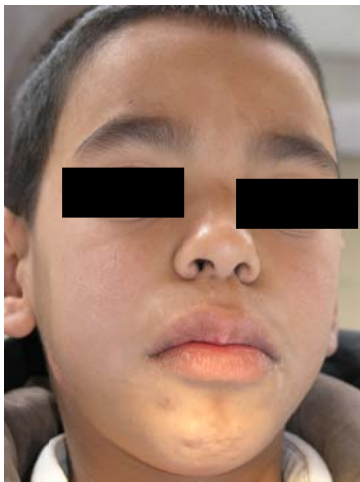
تصویر ۱: در تصویر صورت کشیده و لبهای برجسته و ضخیم مشهود است

دانشکده دندانپزشکی مشهد معرفی شده بود که در معاینات اولیه پس از مشاهده ضایعات برجسته در قدام زبان، به بخش بیماریهای دهان ارجاع داده شد. در معاینات خارج دهانی، بیمار دارای صورت کشیده با لبهای ضخیم، این بایت قدامی ۲ و عدم کفایت لبها ۳ بود (تصویر ۱). همچنین پائین افتادگی پلک ها و ضخیم شدن آنها مشخص بود.