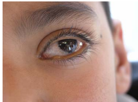
تصویر ۲: پاپولهای حاشیه پلک تحتانی و برگشتن پلکها به سمت خارج مشاهده می شود