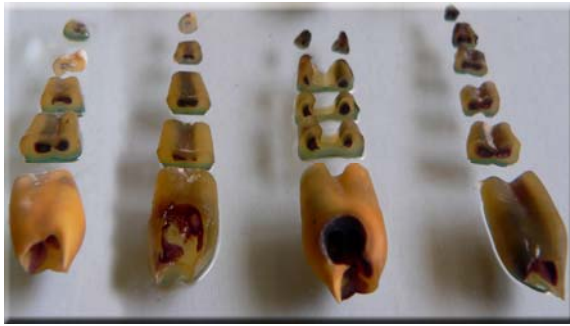
شکل ۲: تعدادی از دندان‌ها بعد از برش عرضی