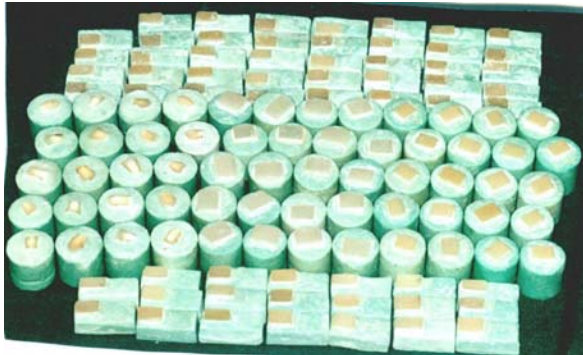
تصویر ۱: نمونه های آماده شده و مانت شده در بلوک های آکریلی

تارجیس انسیزال S1 به ضخامت ۱ میلیمتر قرار گرفت. طبق دستور کارخانه سازنده پس از ۲۰ ثانیه نوردهی و پوشانیدن نمونه ها با ژل تارجیس، آنها را بمدت ۲۵ دقیقه با برنامه شماره ۱ کوره اصلی تارجیس پلیمریزه نمودیم. ۲۰ بلوک از جنس چینی ویتا VMK95 به رنگ A2 و طبق دستور کارخانه سازنده تهیه گردید. ۲۰ بلوک کامپوزیتی از جنس کامپوزیت تتریک سرام HB به رنگ A2 تهیه و به مدت ۶۰ ثانیه با نور مناسب سخت گردید. همچنین ۲۰ نمونه از مینای دندان انسان از سطح فاسیال دندانهای انسیزور بالا که تازه کشیده شده بودند تهیه گردید. کلیه نمونه ها بر روی یک بلوک آکریلی به شکل مستطیل (۱۳×۱۳×۲۳ میلیمتر) که در دستگاه ماشین سایش قرار می گرفت، توسط آکریل فوری ثابت و محکم شدند (تصویر ۱).