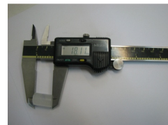
تصویر ۱: اندازه‌گیری با کولیس دیجیتال